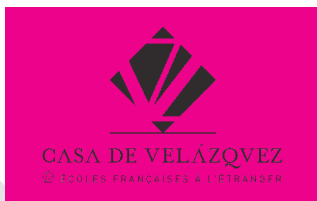
Version positive (noir)