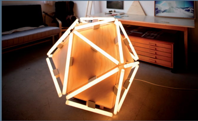
Le quatrième continent · ICO-01 · ampoules linolites · contreplaqué · 2013

Architecte de formation et membre de la Casa de Velázquez-Académie de France à Madrid en 2013, sa recherche artistique étudie les relations que l'architecture tisse avec l'espace. Il s'inscrit dans une démarche d'identification des limites, des zones de contact entre l'espace et le temps, qui constituent des territoires. Ses installations questionnent l'architecture, la science et le paysage.