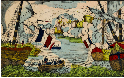
Prise du fort de Saint-Jean d'Ulloa et de la Vera-Cruz, par la marine française, 27 novembre 1838. Image d'Épinal, Imprimerie Pellerin, vers 1880, détail