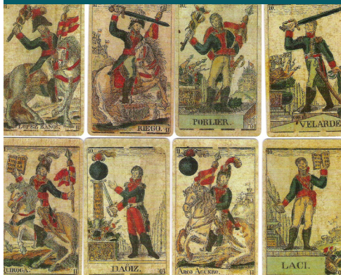
Baraja conmemorativa de la Constitución promulgada en Cádiz en 1812. Fábrica Ardit y Quer y Cia, Fábrica de Simón, 1822, Museo Fournier de Naipes en Álava