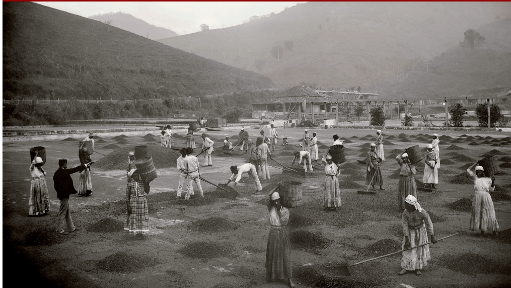
« Escravos em terreiro de uma fazenda de café. Vale do Paraíba », date : circa 1882, Marc Ferrez, Coleção Gilberto Ferrez, Acervo Instituto Moreira Salles.