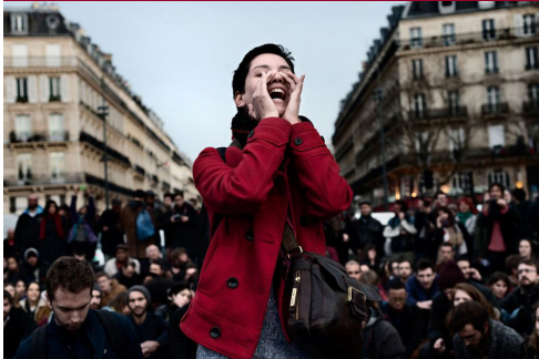
Le 4 avril 2016, place de la République, à Paris. Meyer.