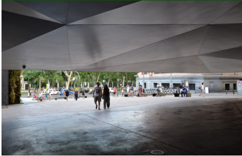
© Ángeles Layuno, Plaza del Caixa Forum (Madrid)