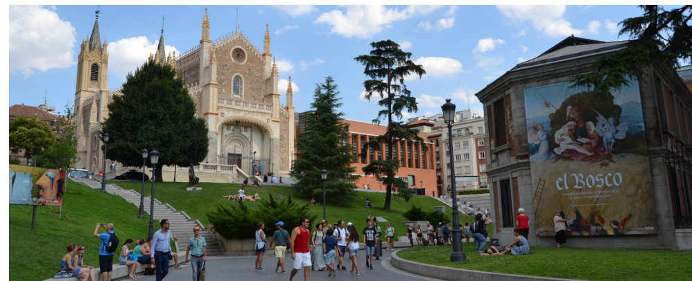
© Ángeles Layuno, Museo del Prado