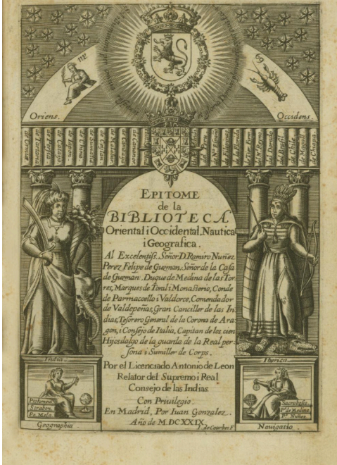
Antonio de León Pinelo, Portada del Epitome de la biblioteca oriental i occidental, nautica i geografica (Madrid, 1629)