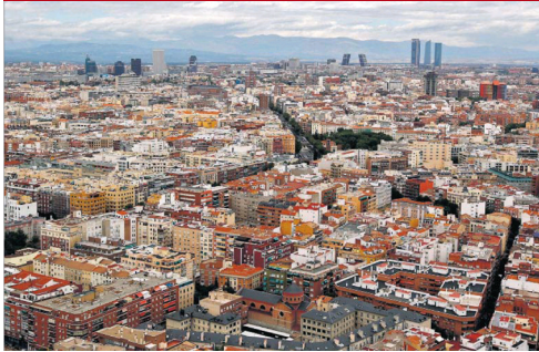
Vista aérea de Madrid