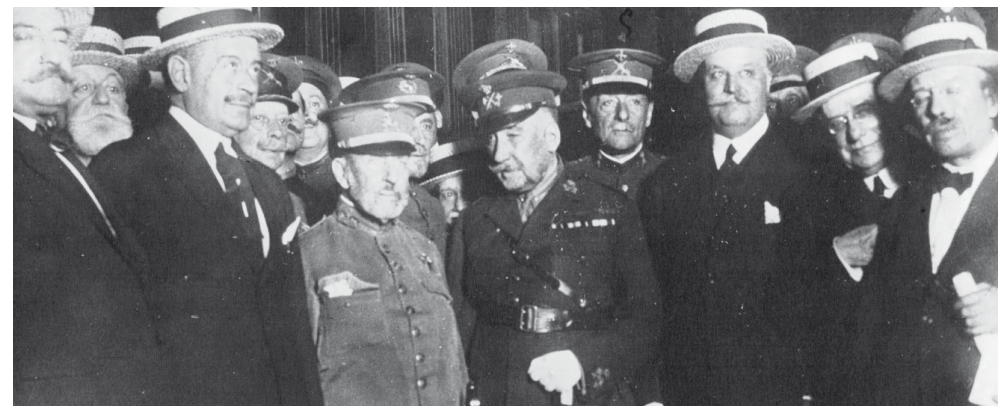
Le général Weyler chargé de prendre le commandement des troupes espagnoles au Maroc, 15 août 1923