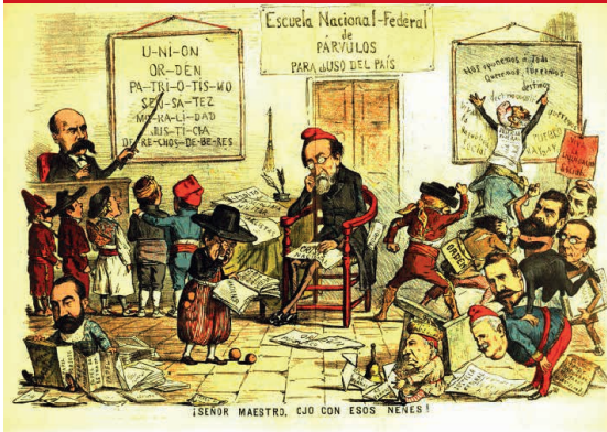
La Flaca, Segunda época (tomo II), num. 72, 8 de julio de 1873