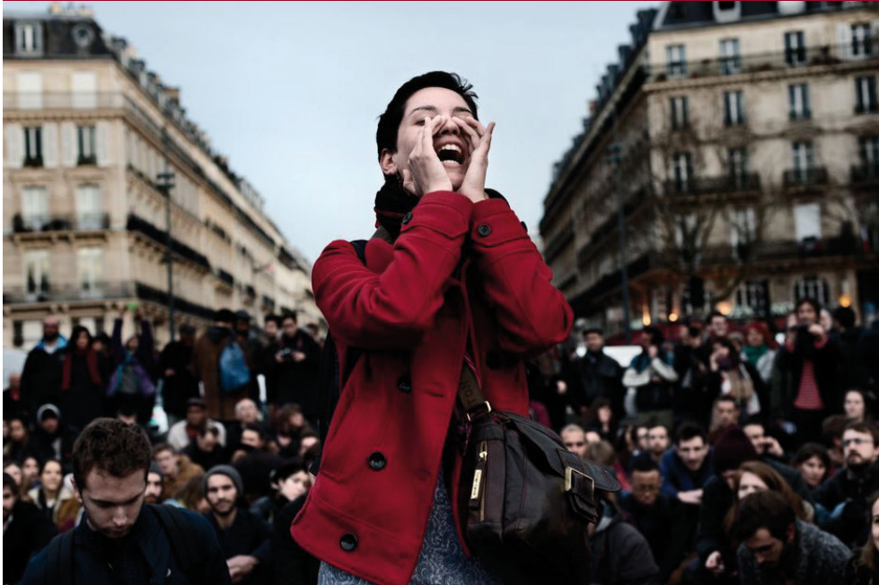
Le 4 avril 2016, place de la République, à Paris. Meyer.