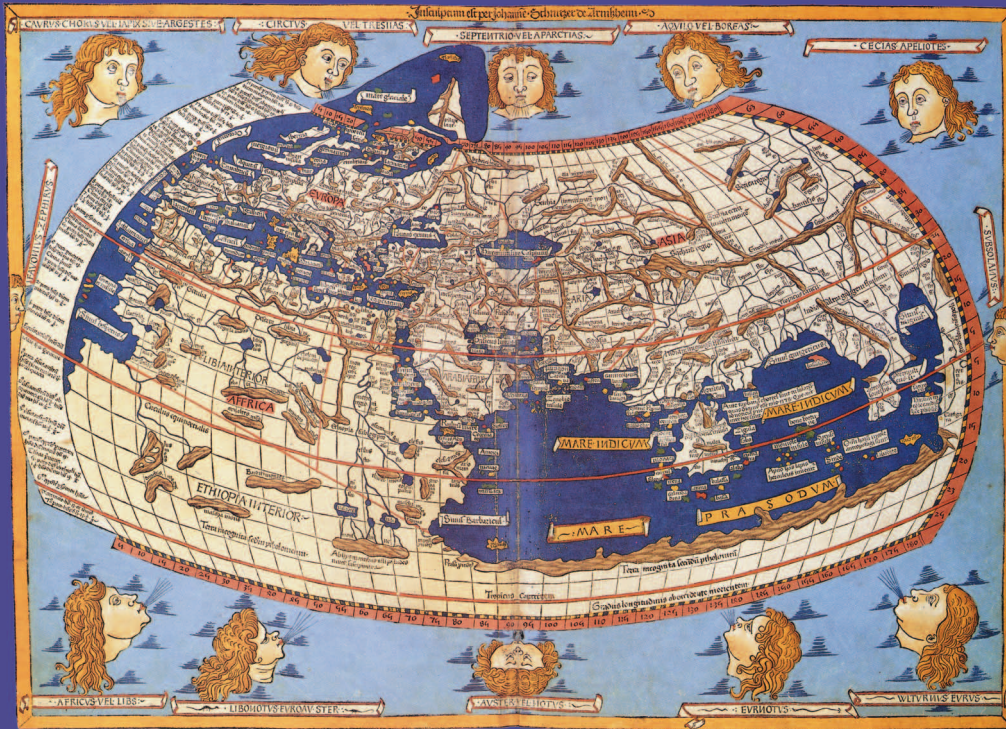
Cosmographie de Ptolémée, édition d'Ulm, 1482.