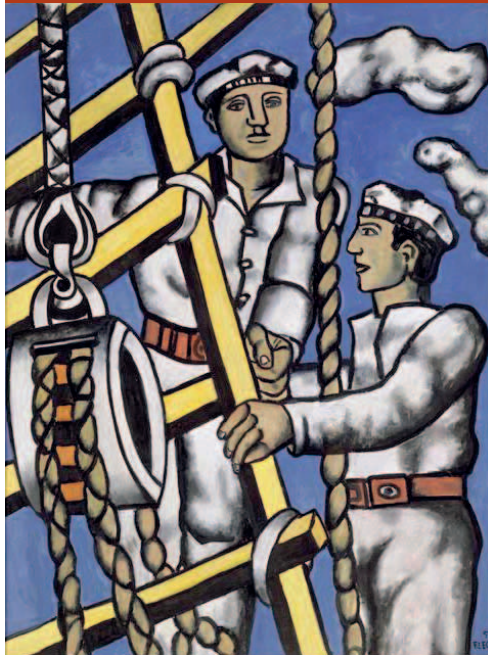
Composition aux deux matelots Fernand-Léger. 1951. Musée national Fernand Léger.