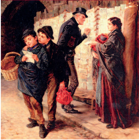
Ralph Hedley, The Ballad Seller (1884). Laing Art Gallery, Newcastle upon Tyne, Reino Unido.