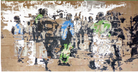
Armand Boua, Foule Dja , 2018, 374 x 200 cm, technique mixte