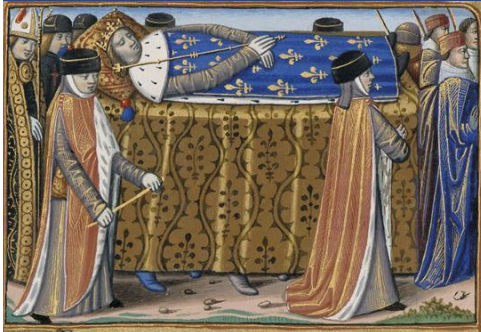
Le cortège funéraire de Charles VI, par Martial d'Auvergne, enluminure issue de l'ouvrage Vigiles de Charles VII , Paris, France, x e siècle, Paris, BnF, département des Manuscrits.