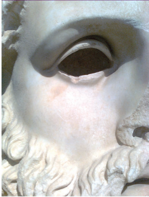
Tête colossale de Zeus d'époque hellénistique attribuée à Euclyde (Musée national archéologique d'Athènes, inv. 3377)