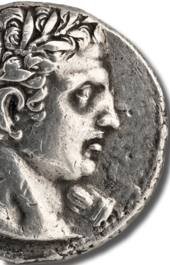
Trishekel hispano-cartaginés de plata, hacia 237-227 a.C. (MAN, 1993/67/1551)