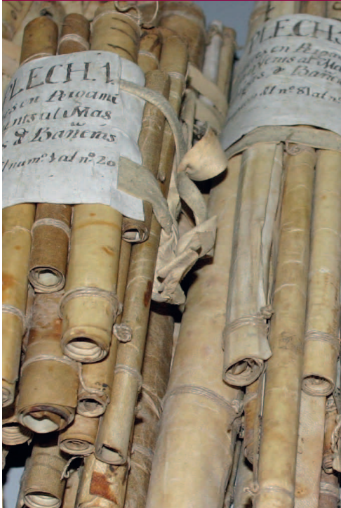
Pliegos de pergaminos del manso Bohigues de Banyeres, tal como se conservaban antiguamente (Fondos patrimoniales Teixidor de Madremanya, Arxiu Històric de Girona)