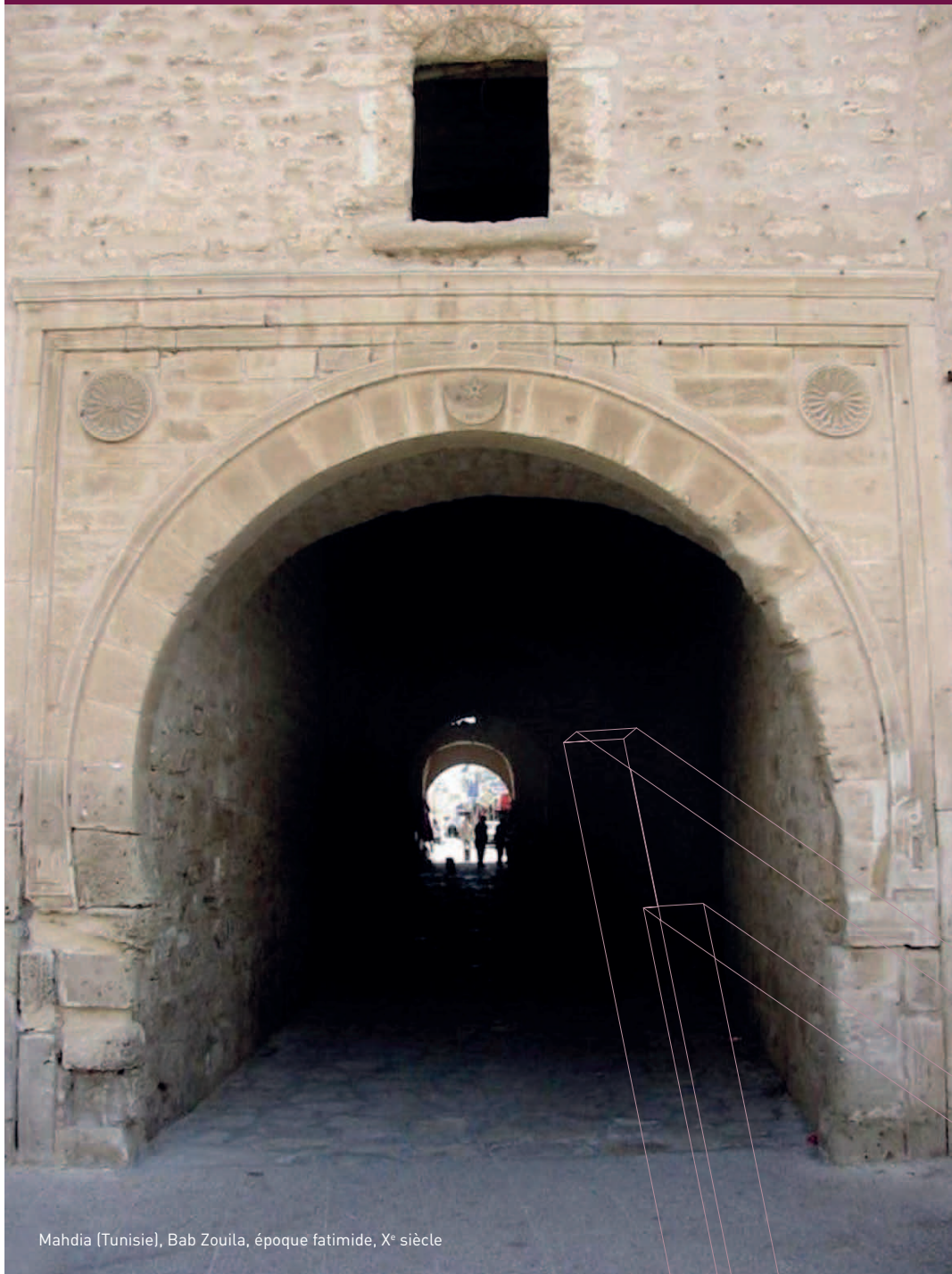
Mahdia (Tunisie), Bab Zouila, époque fatimide, X e siècle